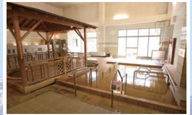
源泉はかけ流して時間をかけた温泉浴を

私の担当は、いつも「ここにやさしいタッチケア講座」等でおこなっている、自分を感じ、つながり、癒し、ゆだねあう、..気づきのワーク。そして、やわらかな、内側とつながり、ふれる手のタッチのやわらかなクオリティとともに、つながることの本質を深めていくこと。理論やテキストは横において、95%、ソマティックな「体験」を中心に行います。自然の中で。(もちろん、実技もやりますよ~)