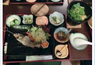
IHANオリジナルメニューをご提供