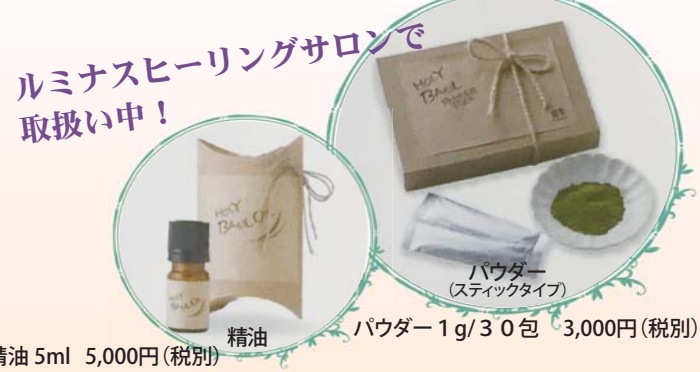
精油 5ml 5,000円(税別) パウダー 1g/30包 3,000円(税別)