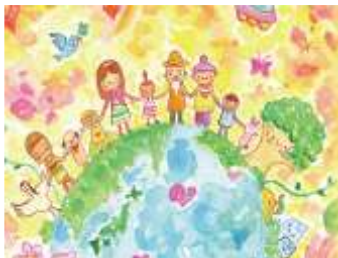
ルミナスの和訪問看護ステーション